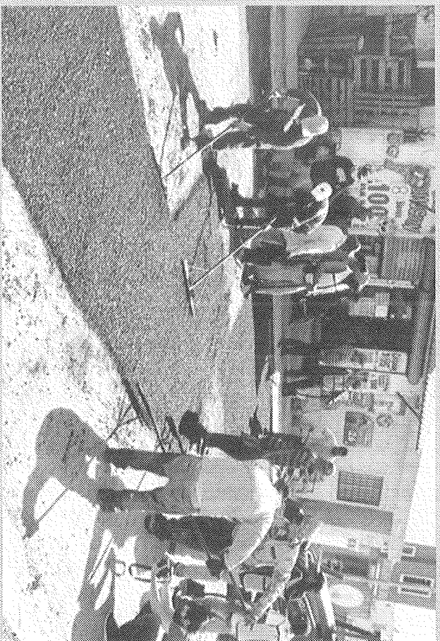
Las cuadrillas trabajan intensamente.

“Continuamos con los recorridos de bacheo permanentemente, en días pasados le toco a la colonia Valle del Virrey en nuestro municipio, continuaremos visitando todas las colonias en las que tengamos reporte y así seguiremos transformando nuestra vialidad”.