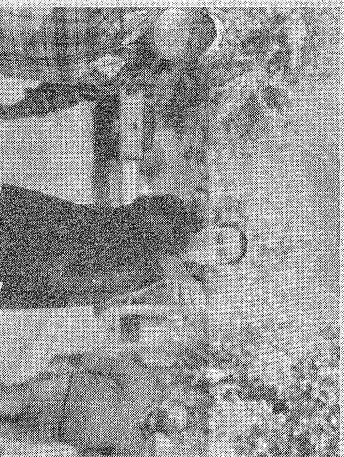
El Alcalde de Juárez sigue rehabilitando calles.